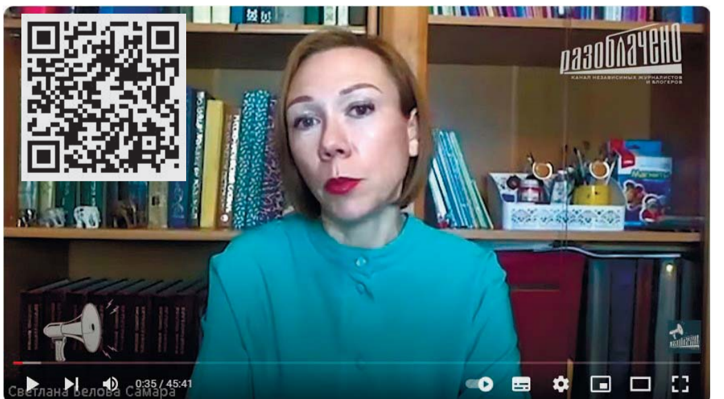
Следователи фабрикуют дела при помощи гадалок?

* * * Почему же ты, моя страна, горемычишь испокон веков? То под власть тирана отдана, то под смутой внутренних врагов... Сколько раз хотели захватить – внешний враг был ловок и силен... И не раз пытались развалить, чтобы по кусочкам взять в полон... Век двадцатый и развал страны – «сыра» вкусушку поманил и она, не чувствуя вины, предала народ и честь могил: непотребство, ложь и воровство в государстве пышно расцвело. И не ум, а лезть и кумовство подлецов и мразь во власть вело. Здесь они привыкли воровать, а на Запад стаскивать бобло, там же ближних родичей ховать... Но элитке там не повезло: их своими не хотят признать, даже Лондон – вотчина воров, говорит: прибудна эта «знать» - раскулачить нашу шваль готов. Веры нет предателю нигде! Отщепенцев, правда, пруд пруди, но г..но всплывает и в воде – вот кого пригрели на груди. Почему же долго так спала Богом избранная Русь моя? Не призыва ль Божьего ждала, чтобы защитить свои края?! И не только - мир земной спасти от чумы, загадившей полмира. Чтоб идти по Божьему пути, надо душу ставить выше «сыра»! А. Гессе